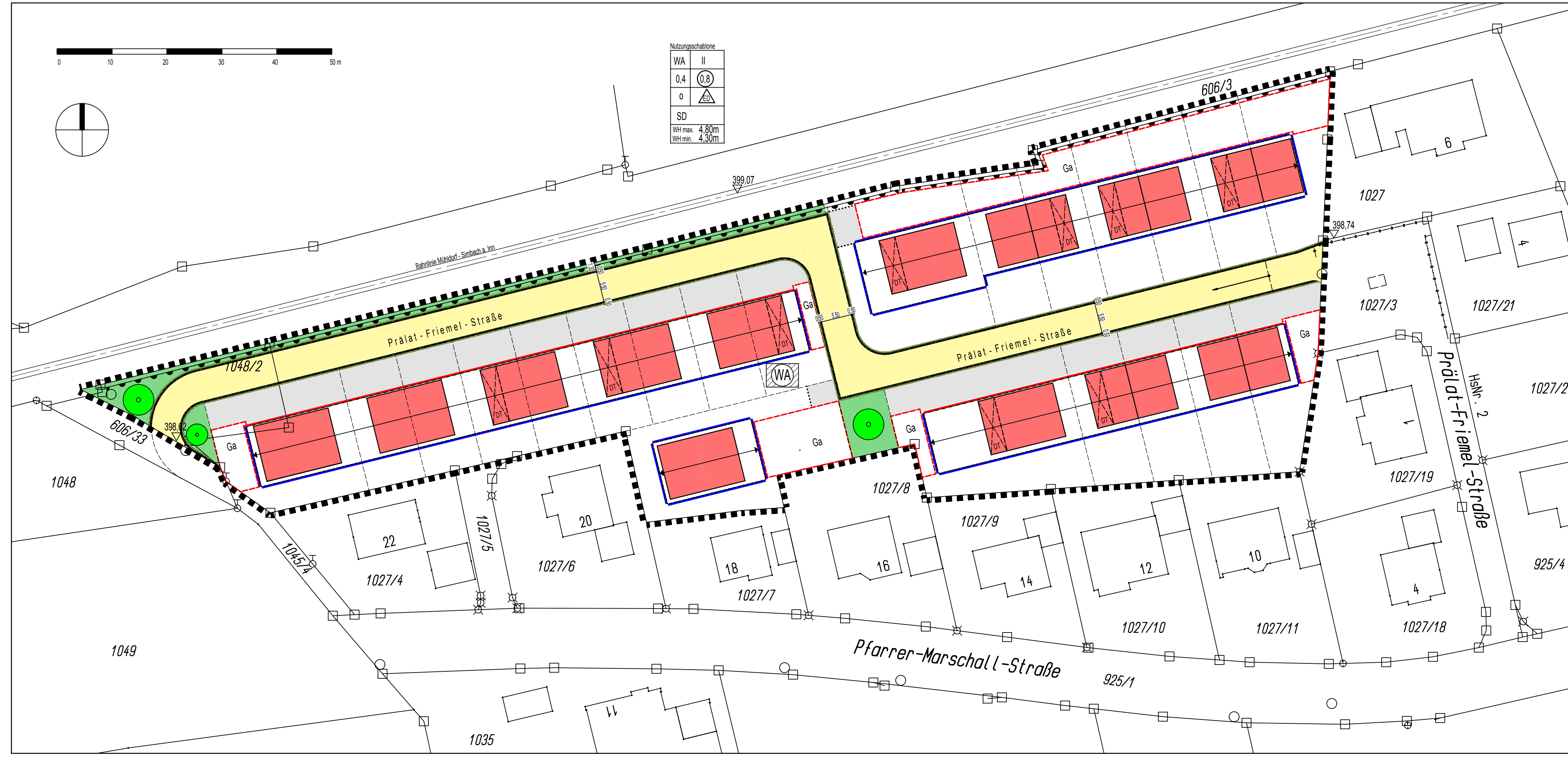
BEBAUUNGSPLAN M 1 : 500

Entwurfsverfasser: Manfred Brunner Dipl.-Ing. (FH) Architekt Schubertstr. 4 84513 Töging a. Inn Tel. 08631/1674511 Fax 08631/1674512 Email: ab@manfred-brunner.de