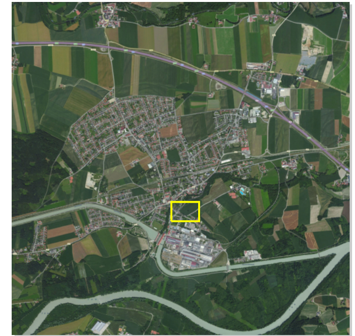
Lage des Änderungsbereichs im Stadtgebiet Töging a. Inn

Flurstücksgrenzen aus digitaler Flurkarte