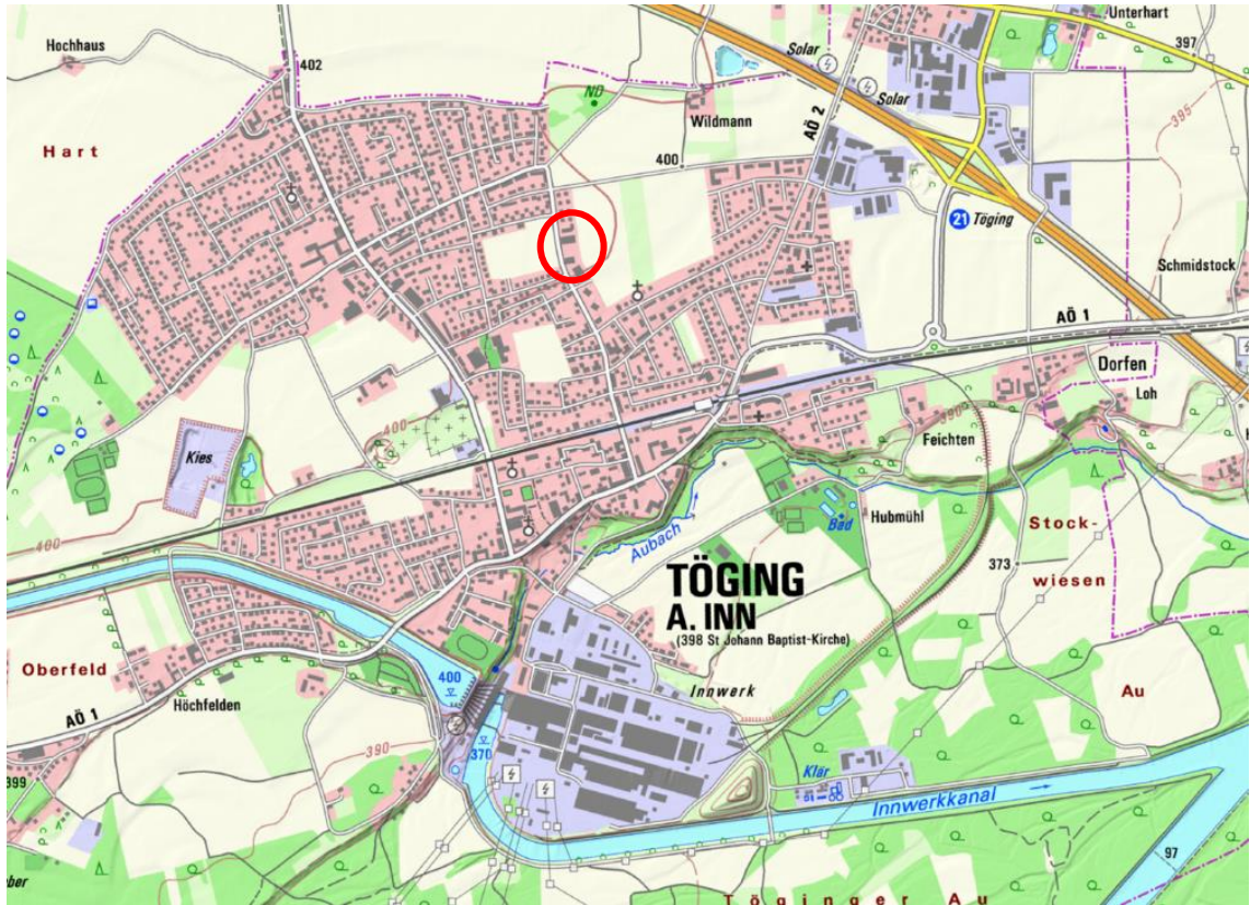
Abb.: Topographische Karte Töging am Inn mit Lage Planungsgebiet (ohne Maßstab)

Der Geltungsbereich des Flächennutzungsplanes befindet sich im nördlichen Stadtgebiet der Stadt Töging am Inn im Landkreis Altötting. Die verkehrliche Anbindung erfolgt über die Wolfgang-Leeb-Straße.