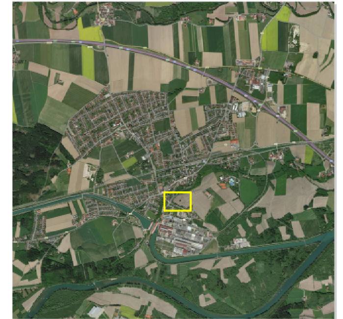
Lage des Änderungsbereichs im Stadtgebiet Töging a. Inn