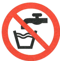
Abbildung 2: Zeichen für „Kein Trinkwasser“

Nichttrinkwasserleitungen sind nach der Trinkwasserverordnung und nach DIN 2403 eindeutig und dauerhaft farblich unterschiedlich zu kennzeichnen, damit es zu keiner Verwechslung kommt. Alle Entnahmestellen der RWNA sind mit einem Schild „Kein Trinkwasser“ oder dem Bild (Abb. 2) zu kennzeichnen.